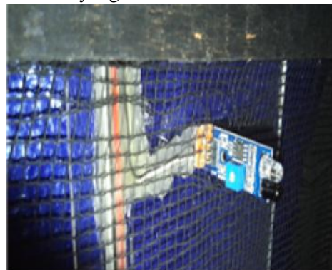
Gambar 6 Sensor Garis