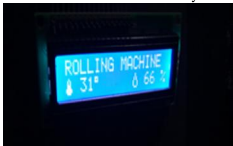
Gambar 4 Alat Aktif