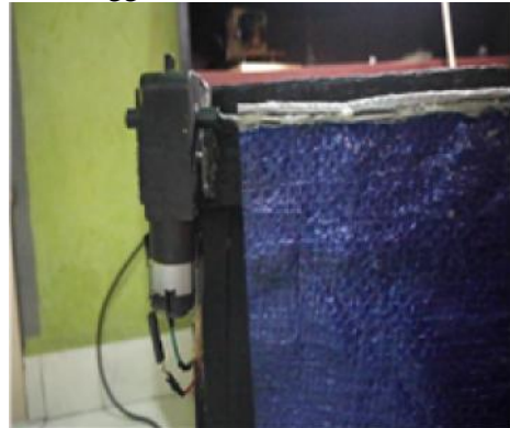
Gambar 5 Motor DC Penggerak Terpal

akan mengolah data tersebut untuk menggerakkan Motor DC