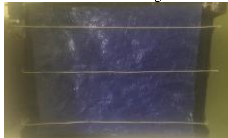
Gambar 7 Besi Penahan Terpal