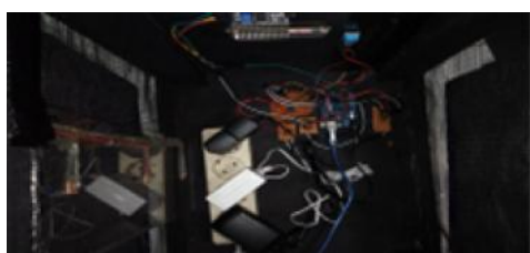
Gambar 8 Gambaran Sempurna Sistem Terpal Kandang Otomatis