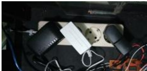
Gambar 3 Pemasangan Kabel Power Adaptor